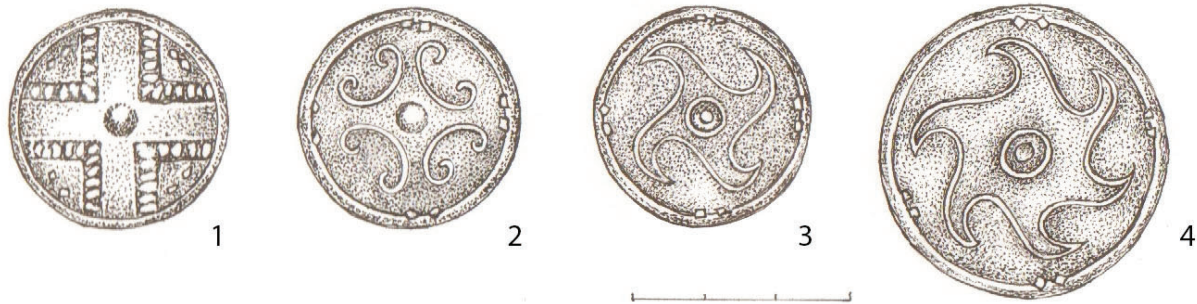
Рис. 3. 1–4: Могильник Ново-Ябалаклинский 1, курган 2, погребение 3. Челюстно-лицевая подвеска. Бляшки: 1 – крест; 2 – крест с завитками; 3, 4 – крест в форме вихревой свастики. Автор рисунка Волкова Н. В.